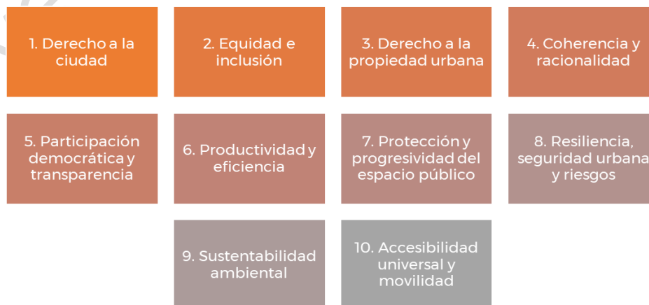
Figura 1. Principios de política pública del PMOTDU